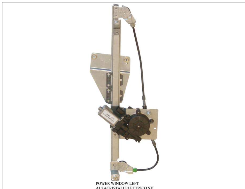
POWER WINDOW LEFT ALZACRISTALI ELETTRICO SX

LA PRESENTE ISTRUZIONE VALE SIA PER IL LATO SINISTRO CHE PER IL LATO DESTRO.